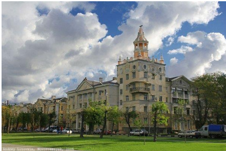
Дом со шпилем. Фото Андрея Литовкина, 2005 год.