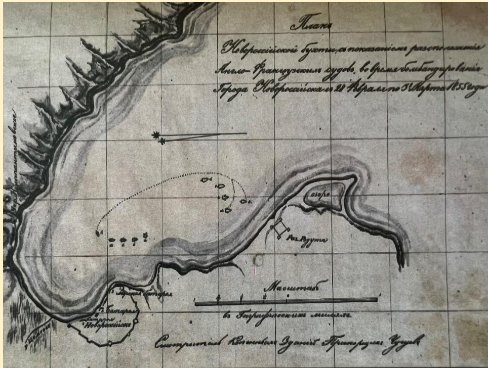
План Новороссийской бухты с указанием расположения англо-французских судов во время бомбардирования Новороссийска с 28 февраля по 3 марта 1855 г.

Автор проекта «Исторические карточки: Новороссийск»: Бережная Юлиана https://t.me/novoros_history_books