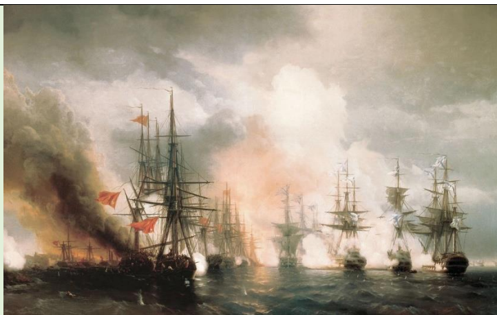
Во время Крымской войны