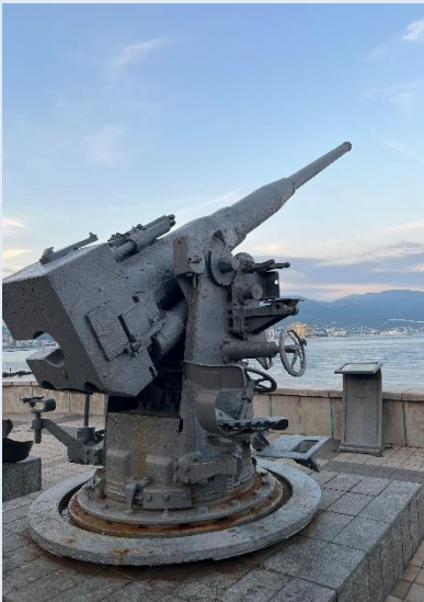
Артиллерийская установка тральщика «Груз»