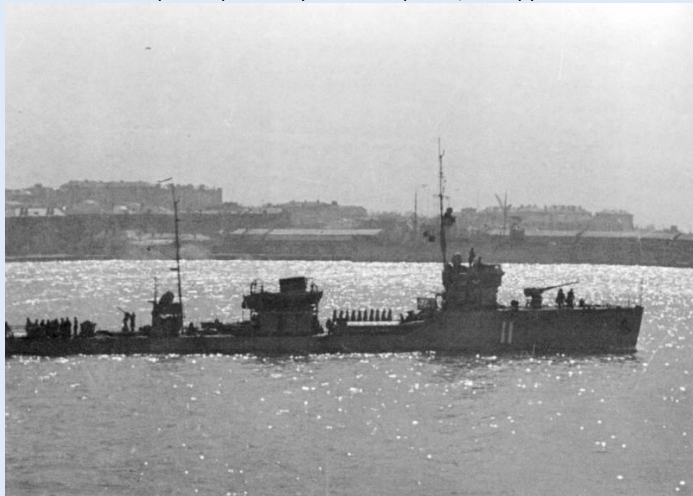
Базовый тральщик (БТЩ)